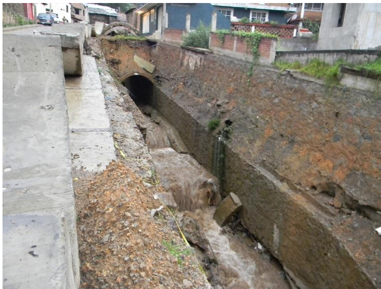
Figura 2. Cauce estrangulado y embovedado.

Teniendo en cuenta la importancia de los cauces y sus riberas por sus funciones y las consecuencias de los efectos negativos en estas por prácticas humanas, se convierten en un objeto necesariamente de protección. De aquí la importancia de reconocer y delimitar estas áreas para establecer los límites de restricción.