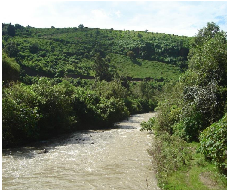
Figura 1. Cauce en su estado natural.

otras actividades se han ido intensificando exponencialmente a lo largo de la historia, llegando en la actualidad a un deterioro alarmante que sigue poniendo en peligro los ecosistemas acuáticos y ribereños, así como la calidad de vida y la seguridad de las localidades contiguas a las riberas.